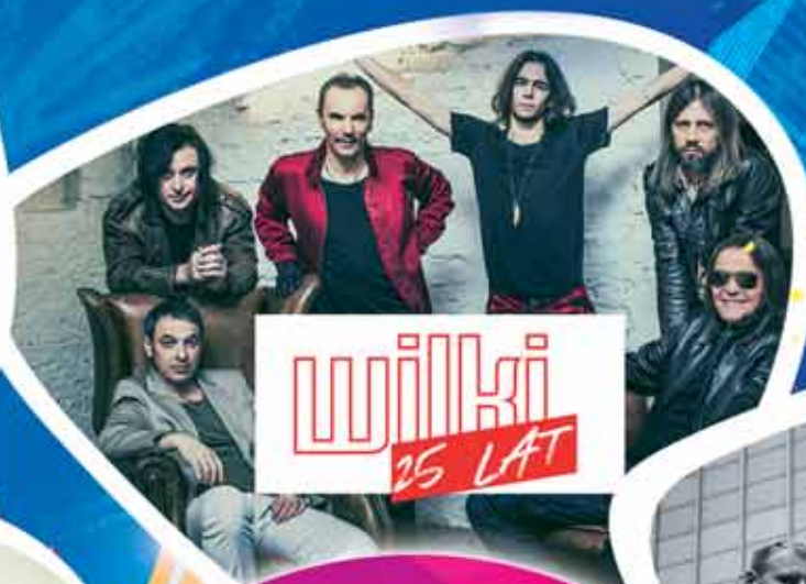
WILKI 25 LAT