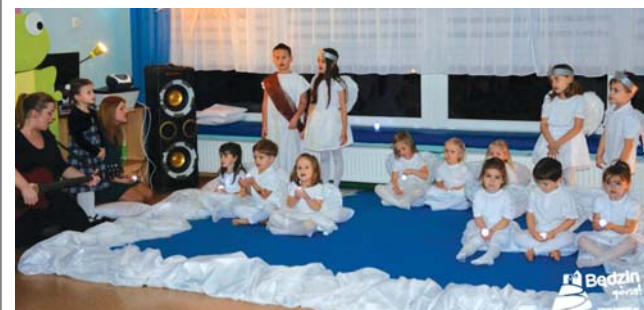
Program artystyczny podczas wigili dla samotnych