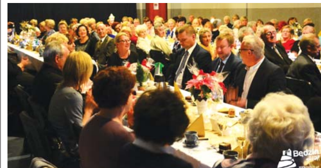
Spotkanie w sali filii Ośrodka Kultury w Grodźcu

Tuż przed świętami będzińskie organizacje pozarządowe tradycyjnie już spotykają się z zaproszonymi gośćmi podczas corocznych spotkań opłatkowych. Uroczystości od lat są okazją do złożenia sobie najlepszych życzeń bożonarodzeniowych. Poniżej zdjęcia z kilku przedświątecznych spotkań.