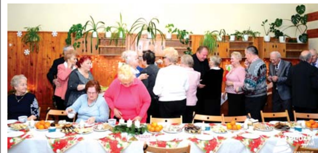
Spotkanie Polskiego Związku Emerytów, Rencistów i Inwalidów o/ Będzin