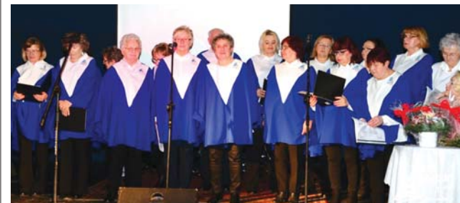
Spotkanie Będzińskiego Uniwersytetu Trzeciego Wieku w Ośrodku Kultury