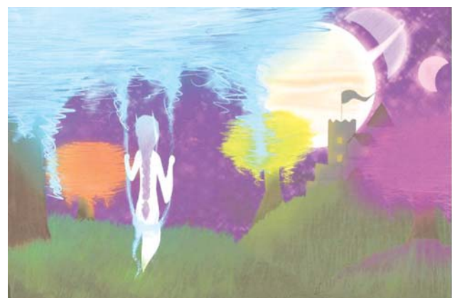
I miejsce w kategorii klasy V-VII

Temat tegorocznego konkursu brzmiał: „Dopóki oddajesz się fantazji, świat staje się niepospolicie piękny, jakim chcesz go widzieć...” Rakesh Satyal. Posługując się techniką komputerową namaluj jak wyobrażasz sobie krainę fantazji. Na konkurs dotarło aż 249 prac, które podzielono na trzy kategorie wiekowe: przedszko-