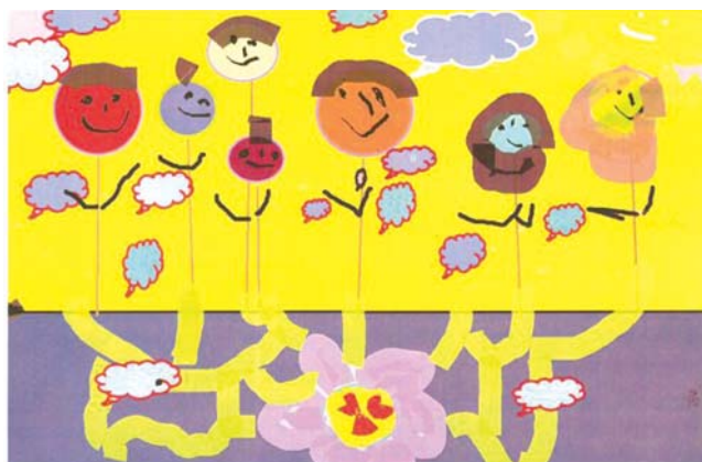
I miejsce w kategorii przedszkola i klasy I

Celem XXI edycji Ogólnopolskiego Konkursu Grafiki Komputerowej jest popularyzowanie grafiki komputerowej, jako współczesnej dziedziny sztuki oraz jako środka wyrazu w twórczości artystycznej, inspirowanie uczniów do twórczych działań, swobodnej ekspresji, rozwoju wyobraźni i wrażliwości estetycznej.