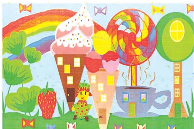
I miejsce w kategorii klasy II-IV

Celem XXI edycji Ogólnopolskiego Konkursu Grafiki Komputerowej jest popularyzowanie grafiki komputerowej, jako współczesnej dziedziny sztuki oraz jako środka wyrazu w twórczości artystycznej, inspirowanie uczniów do twórczych działań, swobodnej ekspresji, rozwoju wyobraźni i wrażliwości estetycznej.