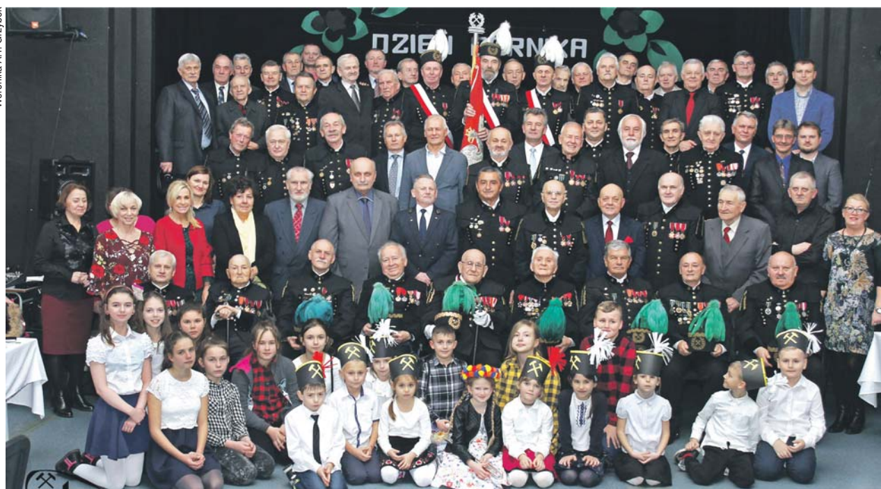
Coroczne spotkanie Barbórkowe organizowane przez Zarząd Koła Stowarzyszenia Inżynierów i Techników Górnictwa „Zagłębie”

Z okazji górniczego święta, składam górnikom i wszystkim pracownikom przemysłu wydobywczego serdeczne życzenia bezpiecznej pracy, zawodowego spełnienia i wszelkiej pomyślności. Słowa szacunku i podziękowań kieruję do wszystkich górniczych rodzin i emerytowanych górników.