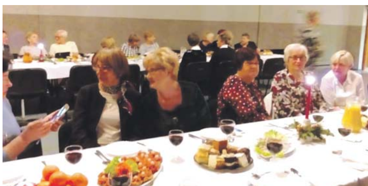
Spotkanie Będzińskiego Stowarzyszenia Amazonek w Grodźcu.