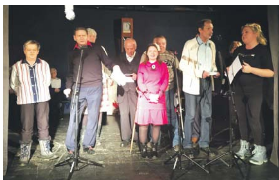
Kolędowanie podopiecznych Dziennego Domu Pomocy Społecznej.