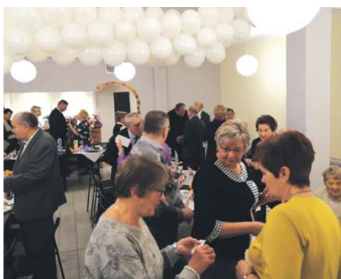
Spotkanie członków Klubu Seniora.