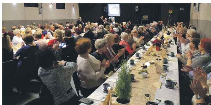
Spotkanie Polskiego Związku Emerytów, Rencistów i Inwalidów o/Będzin.