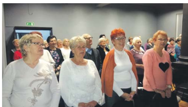
Spotkanie studentów Będzińskiego Uniwersytetu Trzeciego Wieku i kolędowanie z chórem BUTW.