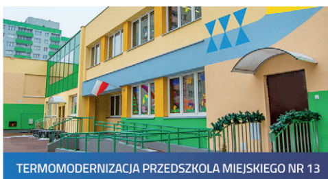
TERMOMODERNIZACJA PRZEDSZKOLA MIEJSKIEGO NR 13