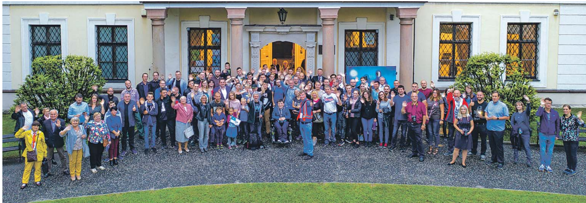
a.c. Muzeum Zagłębia

W niedzielę 8 września przepięknie wnętrza Pałacu Mieroszewskich w Będzinie dosłownie uniosły się w niebo za sprawą 2. Będzińskiego Festiwalu Fotografii, którego tegoroczna edycja w całości poświęcona była lotniczcej pasji.