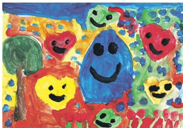
I miejsce kategoria klasy 1-4