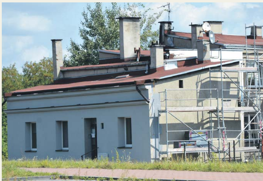
Ulica Gzichowska 34