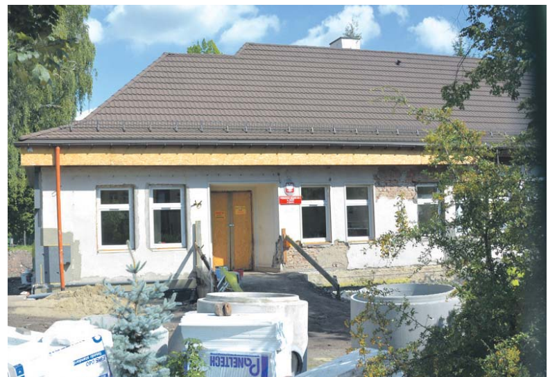
Trwa termomodernizacja budynku Przedszkola Miejskiego nr 6 przy ulicy Wistawy Szyborskiej na Ksawerze.