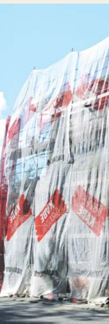
Ulica Podzamcze 29