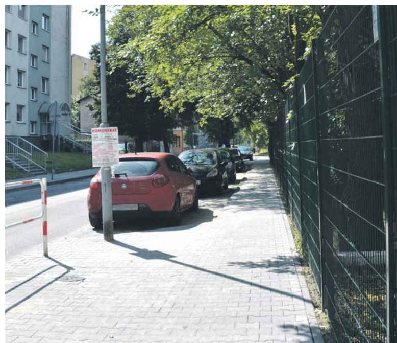
Przy ulicy Wistawy Szymborskiej wymieniono nawierzchnię chodnika i miejsc postojowych po stronie Szkoły Podstawowej nr 4.