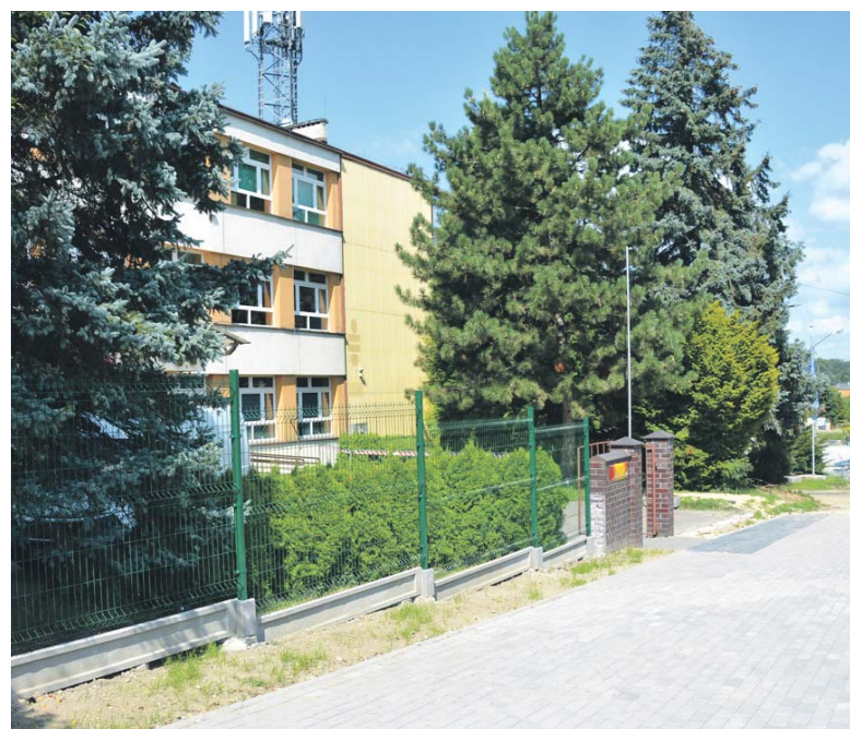
Przy Szkole Podstawowej nr 2 wymieniono przęsła ogrodzenia.