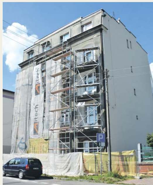
Ulica Krasickiego 8