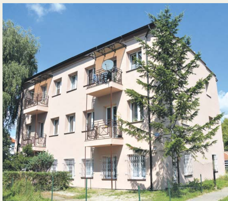
Ulica Grobla 4