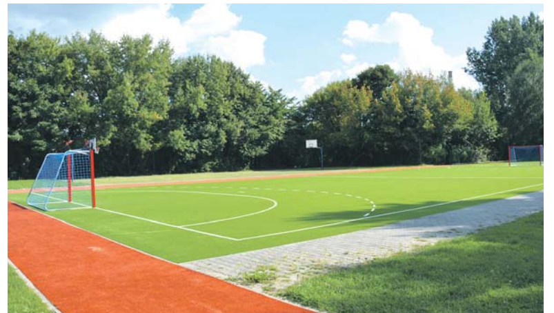
Przy Szkole Podstawowej nr 9 przy ulicy Jedności w Łągiszy zakończyła się wymiana nawierzchni boiska realizowana ze środków przyznanych w ramach budżetu obywatelskiego.

Z kolei w budowanej od czerwca tego roku sali gimnastycznej dla Szkoły Podstawowej nr 2 znajdują się: sala sportowa o powierzchni 521,68 m 2 , widownia, pomieszczenia dla prowadzących zajęcia sportowe, magazyn sprzętu sportowego, przestrzeń komunikacyjna z przedsionkami, sanitariat dla osób niepełnosprawnych, szatnie męskie i damskie z węzłami sanitarnymi, pomieszczenie na sprzęt porządkowy, salka treningowa. W sali sportowej zaprojektowano boisko do gry w piłkę siatkową (główne boisko), dwa boiska treningowe poprzeczne do piłki siatkowej, boisko do koszykówki, boisko do piłki nożnej halowej i do piłki ręcznej. Dodatkowo zaplanowano remont parkingu szkolnego i drogi dojazdowej do szkoły. ■