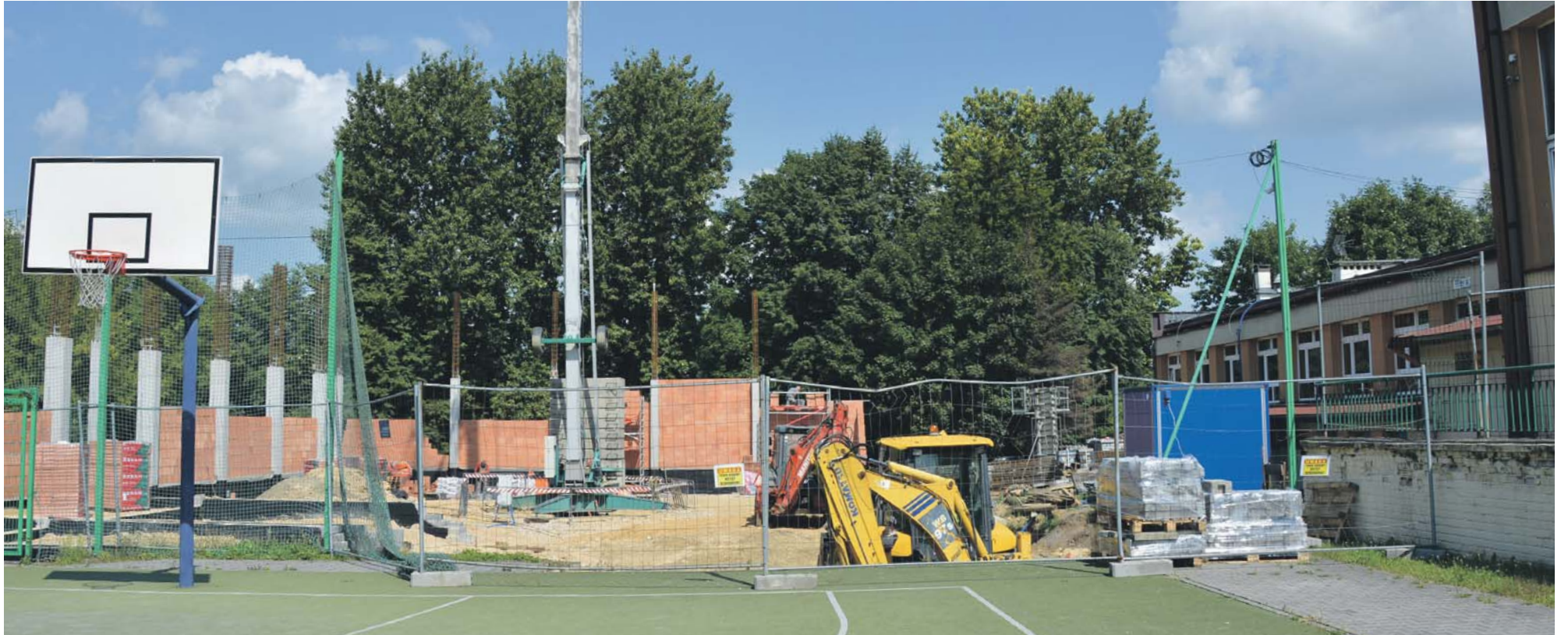
Trwa budowa nowej hali sportowej przy Szkole Podstawowej nr 2 przy ulicy Wolności 51 na Zamkowym.

➤ Lato to czas odpoczynku dla uczniów, ale w placówkach oświatowych to moment na wpuszczenie tam ekip budowlanych. W okresie wakacyjnym prace remontowe i modernizacyjne realizowano w prowadzonych przez Miasto Będzin dziewięciu szkołach podstawowych oraz w pięciu przedszkolach.