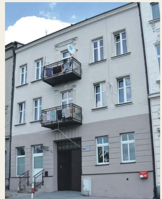
Plac 3 Maja 11