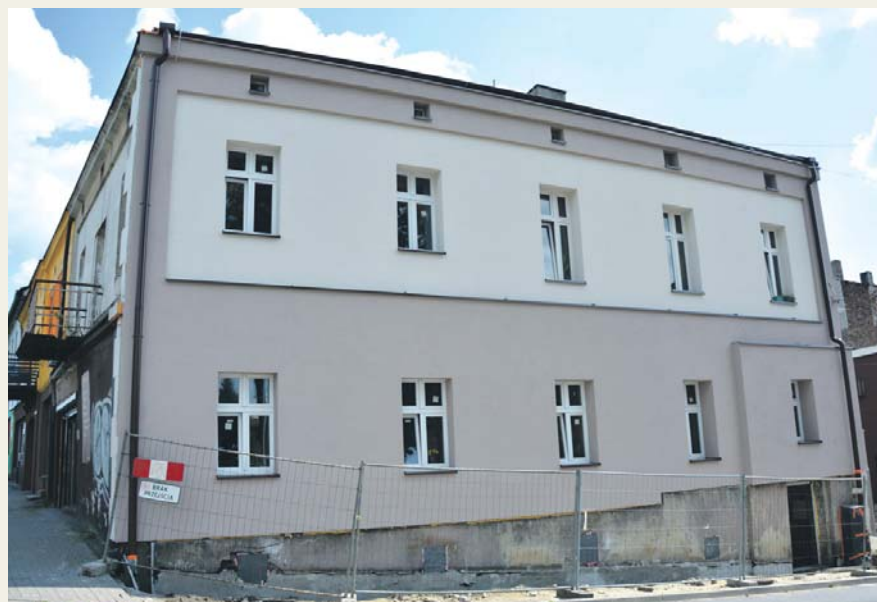
Ulica Modrzejowska 15