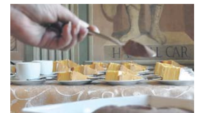
Sernik wiedeński na ostodę spotkania.

wa się – „szechita” i jakie produkty są koszerne a jakie „nieczyste” np. dlaczego Żydzi nie mogą jeść wieprzowiny, węgorki czy owoców morza. Poznali też odpowiedź na najważniejsze pytanie: jaki jest sens tych wszystkich drobiazgowych przepisów i zasad, które dzisiaj mogą nam się wydawać już nieco archaiczne i nieprzystosowane do wymogów współczesnego świata. Po wykładzie uczestnicy udali z się na krótki spacer śladami Żydów będzińskich zakończony zwiedzaniem domu modlitwy „Mizrach”.