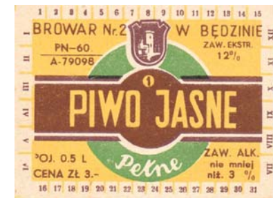
Etykiety piwa produkowanego w Będzińskich Zakładach Piwowarskich – Stodownicznych, lata 50. i 60. XX w., Browar nr 2 – „Zamkowy” (ze zbiorów A. Babińskiego).

na społeczność wyznania mojżeszowego, temat ten był niezwykle ważny. Religijny Żyd musi zawsze wiedzieć co je, kiedy je, jakie mięso spożywa, jak uśmiercone było zwierzę i jak przygotowywano potrawę. Większość przepisów dotyczących sposobu przygotowania pokarmów, zawartych w żydowskim kodeksie dietetycznym, pochodzi z Tory. W trakcie wykładu poświęconego specyfice kuchni żydowskiej omówiono szczegółowo zasady kaszrutu i przedstawiono typowe potrawy. Uczestnicy dowiedzieli się jak odby-