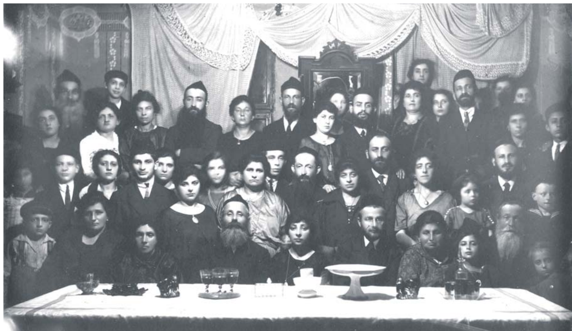
Zdjęcie rodziny żydowskiej.

18 września zorganizowano spacer historyczny: Między tradycją a nowoczesnością, czyli jak jadano nad Czarną Przemszą. Historia przetwórstwa spożywczego na terenie Będzina. Spacer rozpoczyna się w Pałacu Mieroszewskich, gdzie uczestnicy poznają sposoby prze-