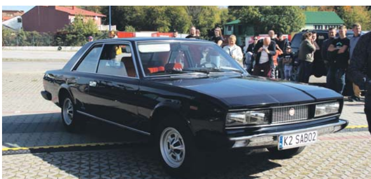
Fiat 130 coupe pininfarina z 1973 r.