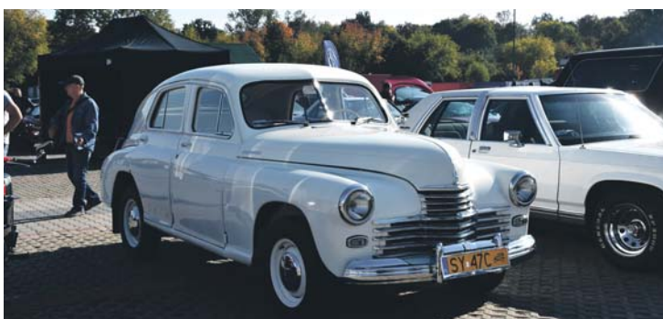
Warszawa M20 z 1953 r.