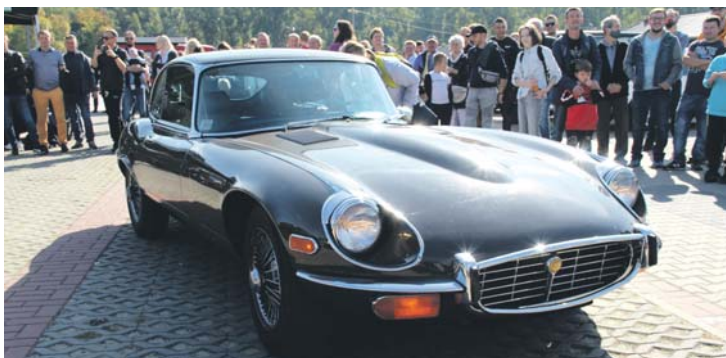
Jaguar E-type V12 5.3 L 1972 r.

Oto lista zwycięzców październikowego zlotu: I miejsce – Jaguar E-type V12 5.3 L 1972 r. Właściciel jest miłośnikiem angielskiej motoryzacji, sprowadził go w oryginalnym stanie z USA. II miejsce – Warszawa M20 z 1953 roku. III miejsce – Fiat 130 coupe pininfarina z 1973 roku – samochód po wizualnej renowacji we Włoszech. Silnik, skrzynię biegów oraz wiele innych elementów mechanicznych wyremontował właściciel. Wyróżnienie – Chrysler Newport Custom z 1971 roku nabyty w Polsce. Właściciel razem z córką nazwali auto „krokodyl”. Tym spotkaniem zakończył się sezon zlotowy, a rozpoczął sezon garażowo-remontowy. Kolejna Klasyczna Niedziela w Będzinie już wiosną 2022 roku. Do zobaczenia!