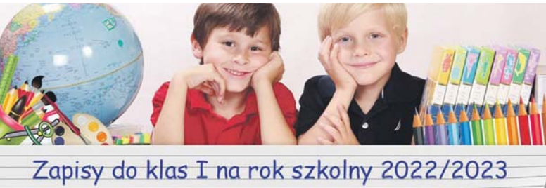
Zapisy do klas I na rok szkolny 2022/2023

Do klasy pierwszej w roku szkolnym 2022/2023 przyjmowane są: • dzieci 7-letnie (urodzone w 2015 roku), które nie rozpoczęły spełniania obowiązku szkolnego w roku szkolnym 2021/2022, • dzieci 6-letnie (urodzone w 2016 roku), których rodzice zdecydowali się skorzystać z prawa do wcześniejszego rozpoczęcia nauki w szkole; warunek przyjęcia: korzystanie z wychowania przedszkolnego w roku szkolnym 2021/2022 lub uzyskanie opinii poradni psychologiczno-pedagogicznej o możliwości rozpoczęcia nauki w szkole podstawowej. Kandydaci zamieszkałi w obwodzie danej szkoły podstawowej, którzy ubiegają się o przyjęcie do klasy pierwszej, przyjmowani są z urzędu na podstawie zgłoszenia. Rodzice/opiekunowie prawni kandydata, zamieszkałego w obwodzie szkoły, składają do dyrektora szkoły zgłoszenie o przyjęcie dziecka do klasy pierwszej, zgodne z ustalonym wzorem, w terminie od 14 lutego 2022 roku do 21 marca 2022 roku. Skorzystanie z miejsca w szkole ob-