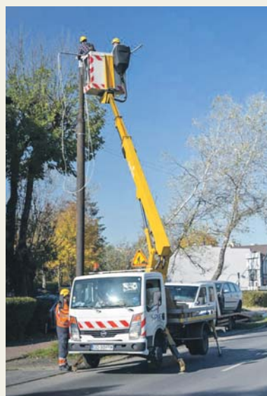
Wymiana lamp na oprawy ledowe