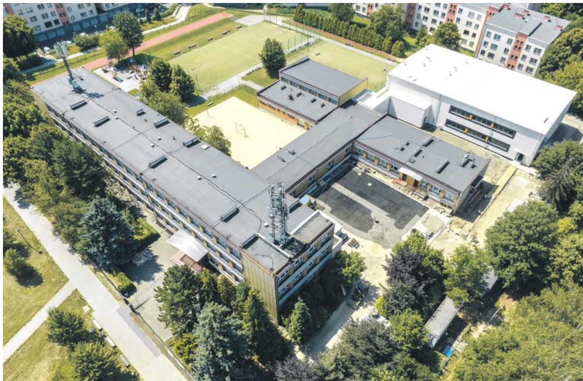
stawowej nr 2 na Zamkowym ćwiczą na nowej hali sportowej. Tak obiekt prezentuje się w środku oraz z wysokości drona.