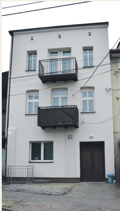
Termomodernizacja, ul. 1 Maja 24