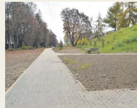
Park Przyjaźni Polsko-Węgierskiej, Syberka