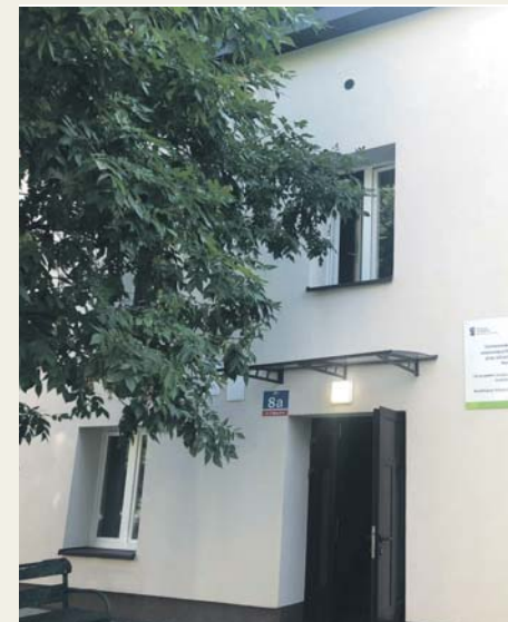
Termomodernizacja, ul. 1 Maja 8a

– W nowy rok weszliśmy z nowymi planami, ale nie ukrywam, że musieliśmy mocno się zastanowić, które inwestycje zrealizować w pierwszej kolejności. Z ważniejszych mogą wymienić przebudowę basenu przy Szkole Podstawowej nr 10, termomodernizację budynku Teatru Dzieci Zagłębia, modernizację oraz