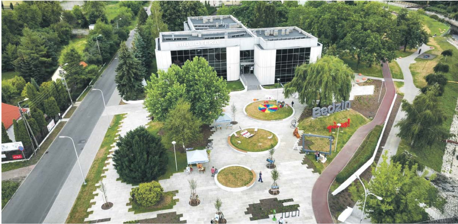
Trzeci etap rewitalizacji Bulwarów Czarnej Przemyszy – odcinek od ulicy Piłsudskiego w kierunku ulicy Krasickiego oraz reprezentacyjny plac przed biblioteką.