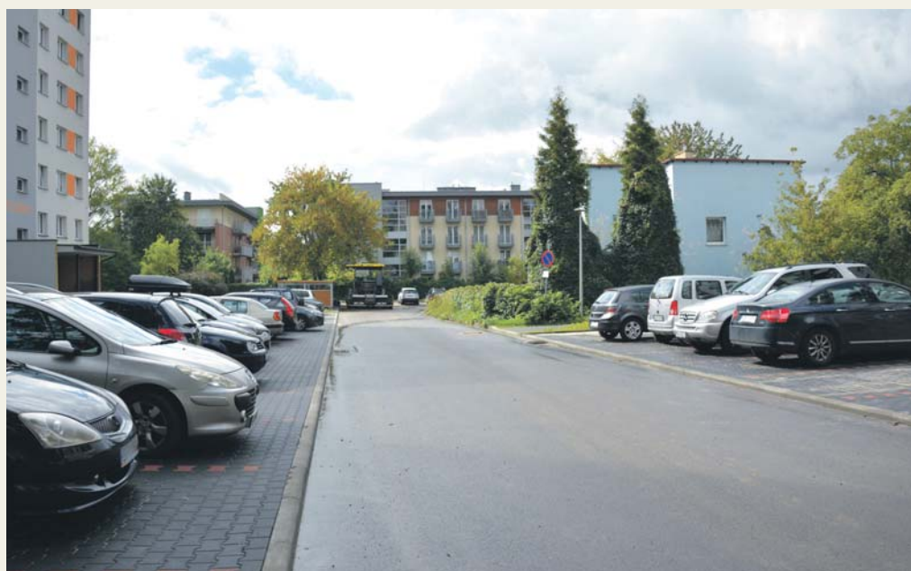
Nowe parkingi i nawierzchnie dróg, Warpie