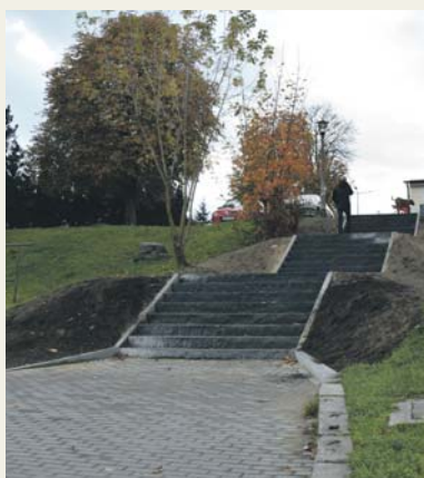
Nowe schody, ul. W. Szymborskiej