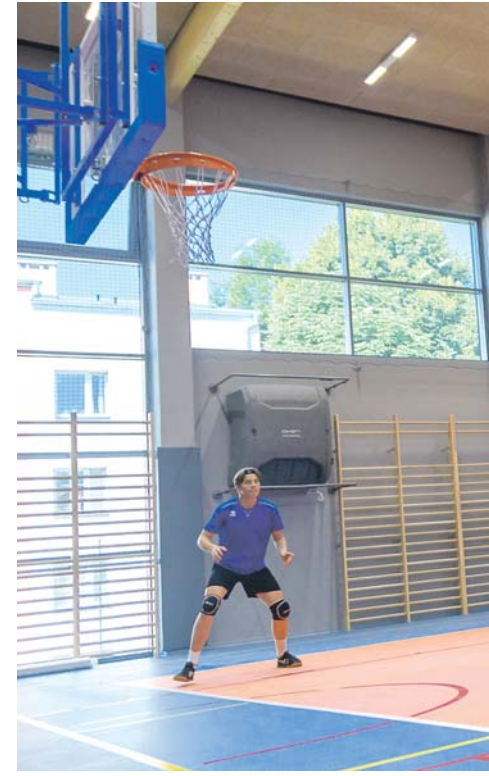
Od 1 września 2022 roku uczniowie Szkoły Podstawowej nr 2 na Zamkowym.