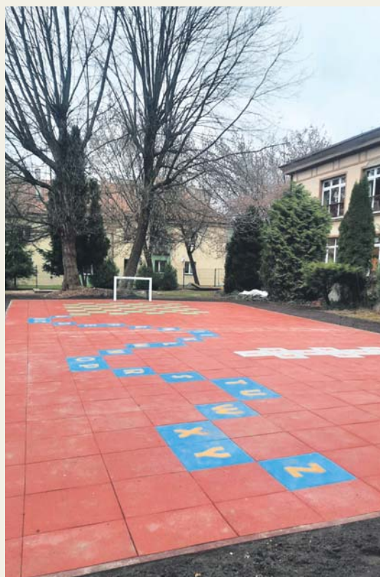
Bezpieczny plac zabaw, Przedszkole Miejskie nr 1