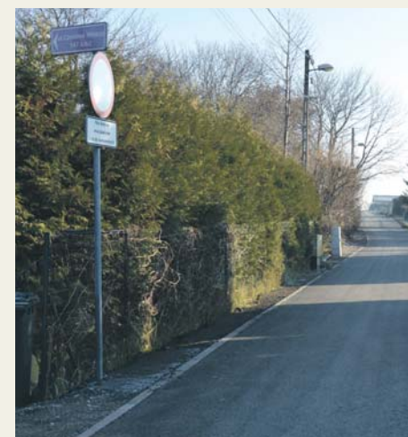
Nowa nawierzchnia drogi, ul. Czesława Miłosza