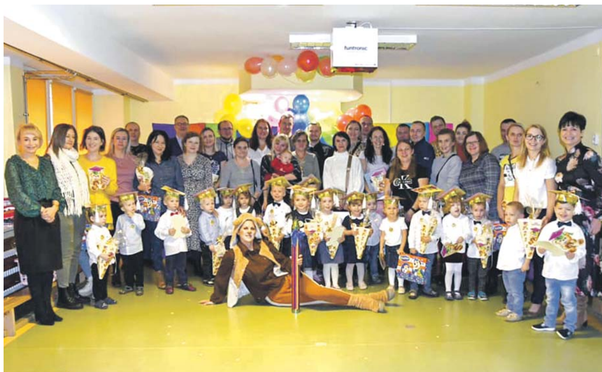
Pasowanie w Przedszkolu Miejskim nr 10 odbyło się 24 listopada.