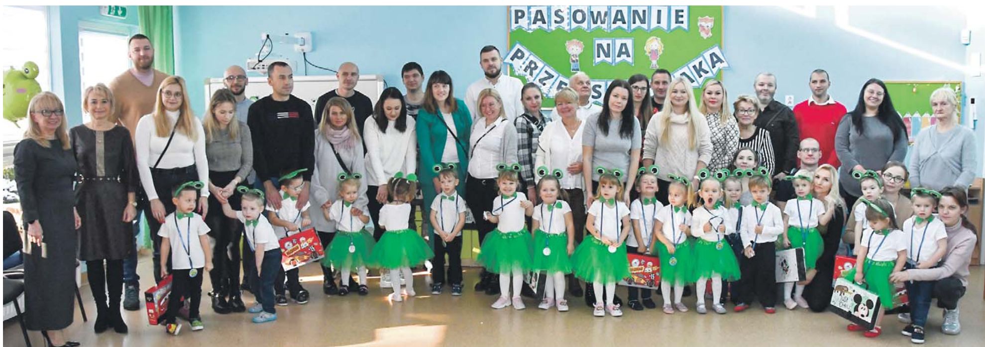
Pasowanie w Przedszkolu Miejskim nr 5 odbyło się 27 listopada.