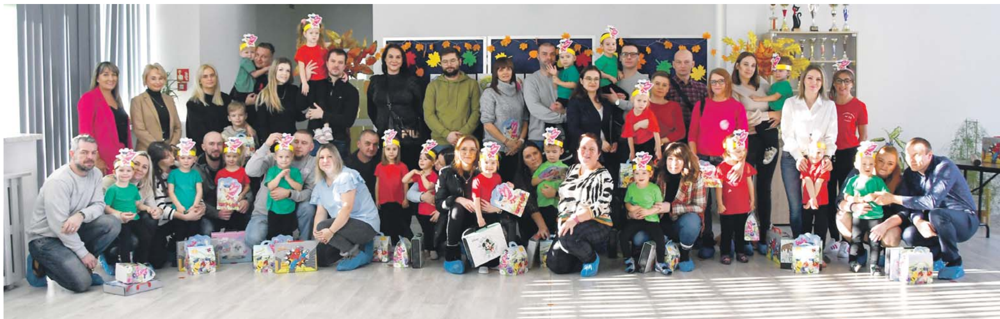
Pasowanie w Przedszkolu Miejskim nr 13 odbyło się 4 grudnia.

W grudniu w będzińskich przedszkolach zakończyły się uroczystości pasowania na przedszkolaka. W tej podniosłej chwili uczestniczyli rodzice i najbliżsi oraz władze miasta. Na pamiątkę tego ważnego wydarzenia każdy maluszek został obdarowany wyprawką przedszkolaka i w pełni stał się członkiem społeczności przedszkolnej.