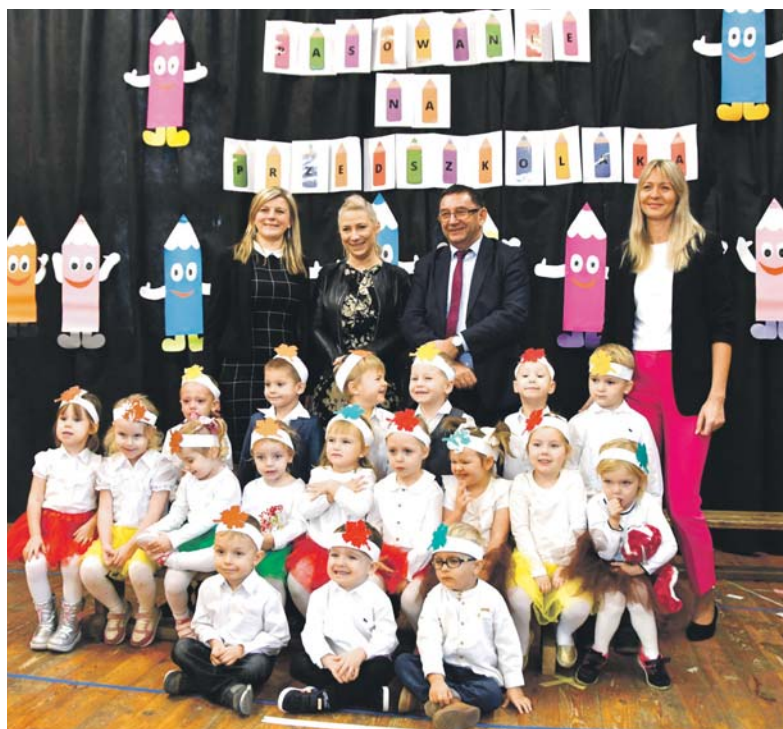
Pasowanie w Przedszkolu Miejskim nr 12 odbyło się 29 listopada.