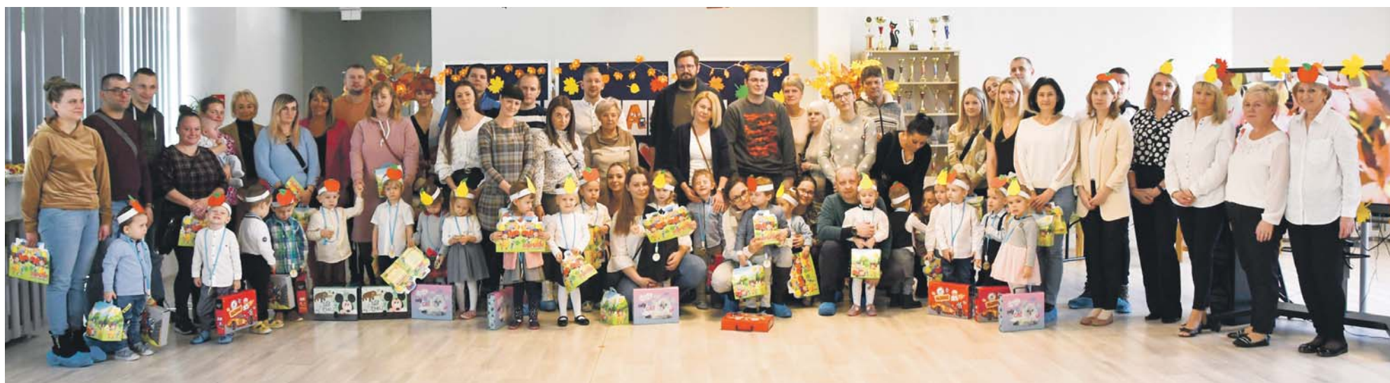
Pasowanie w Przedszkolu Miejskim nr 13 odbyło się 4 grudnia.