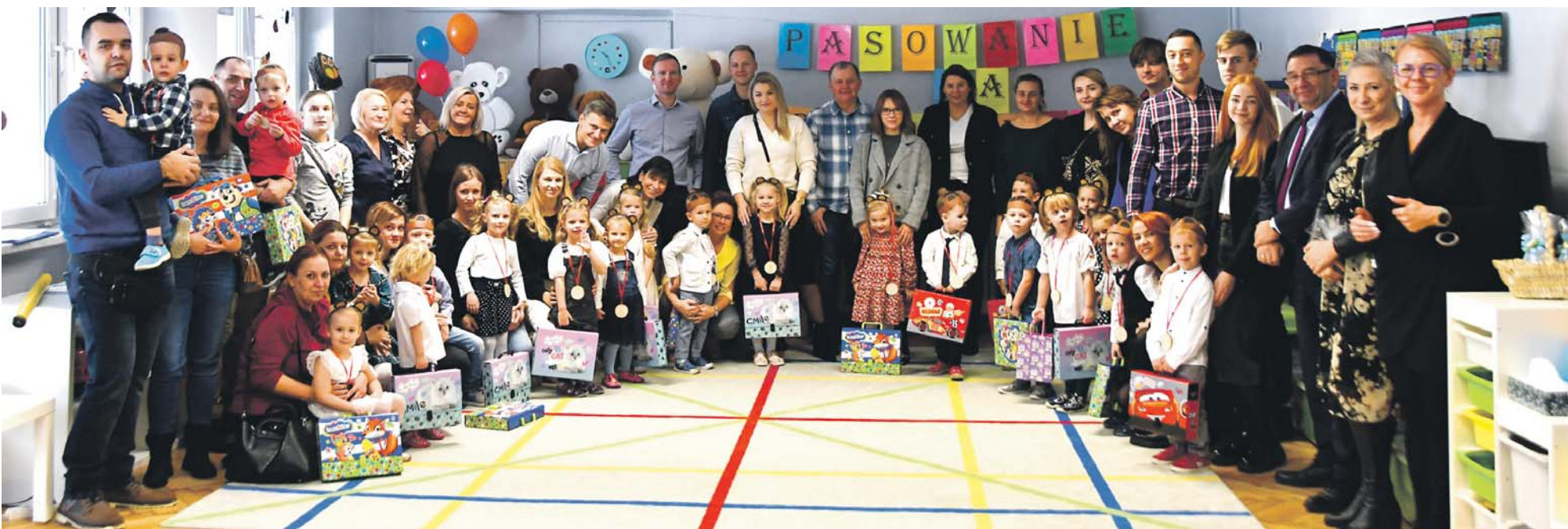
Pasowanie w Przedszkolu Miejskim nr 8 odbyło się 29 listopada.