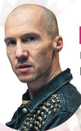
MEZO Koncert | godz. 12:15