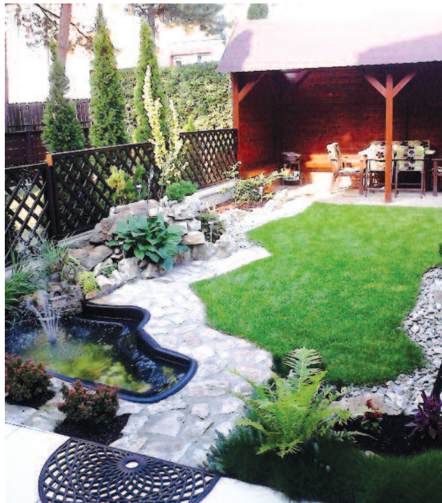
I miejsce zajął ogród Czesława Kowala

Serdecznie gratulujemy pasjonatom biorącym udział w zmaganiach i zapraszamy wszystkich chętnych do udziału w tegorocznym konkursie.