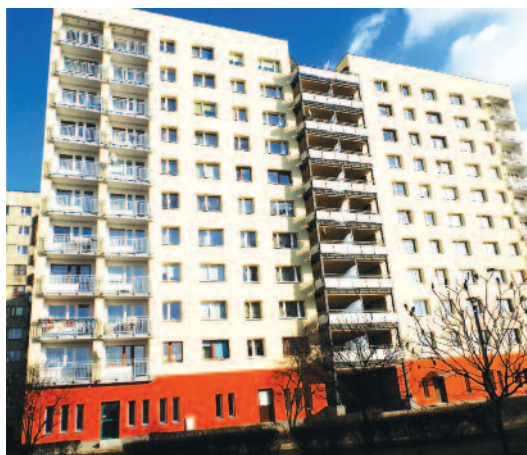
Na Warpiu zakończono prace przy ulicy XXXV-lecia PRL 15 i 17 oraz przy ulicy Generała W. Andersa 17 i 19