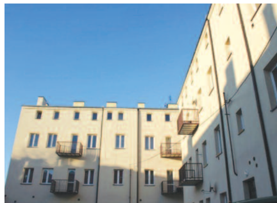
Ściany kamienic przy ulicach Małachowskiego 42, Joselewicza 8 i 16, Czeladzkiej 10 oraz przy Al. Kółkajata 34 zostały ocieplone i pokryte nową elewacją.