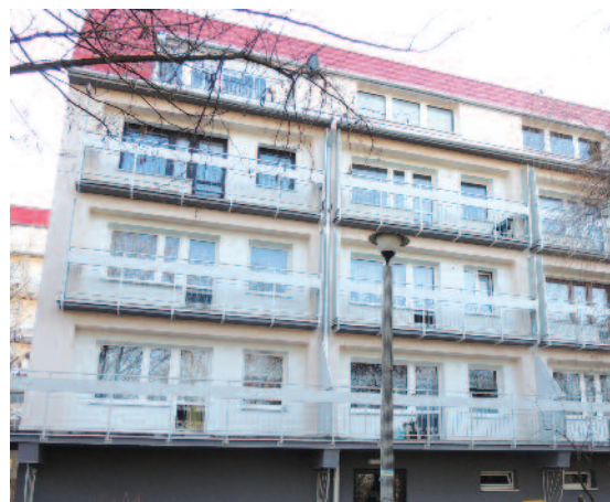
Termomodernizację przeszły już bloki przy ulicy Basztowej 2 oraz Bursztynowej 1 na osiedlu Zamkowym