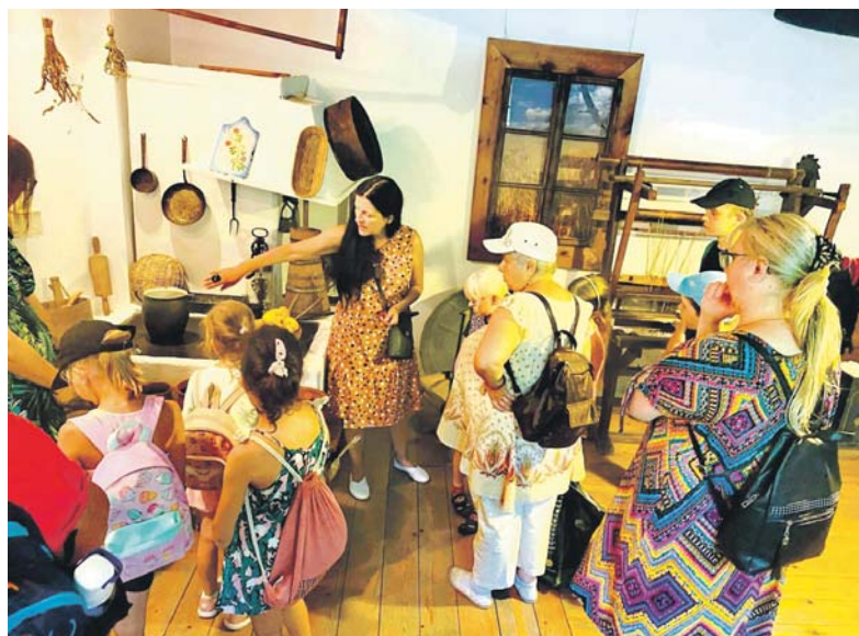
Tak bawili się uczestnicy Wakacyjnych Warsztatów Muzealnych pod nazwą Odkrywamy ślady przeszłości, zorganizowanych w lipcu w Muzeum Zagłębia.

Co prawda lipcowe Wakacyjne Warsztaty Muzealne w Muzeum Zagłębia w Będzinie już się zakończyły, ale to nie koniec letnich atrakcji dla młodszych mieszkańców.