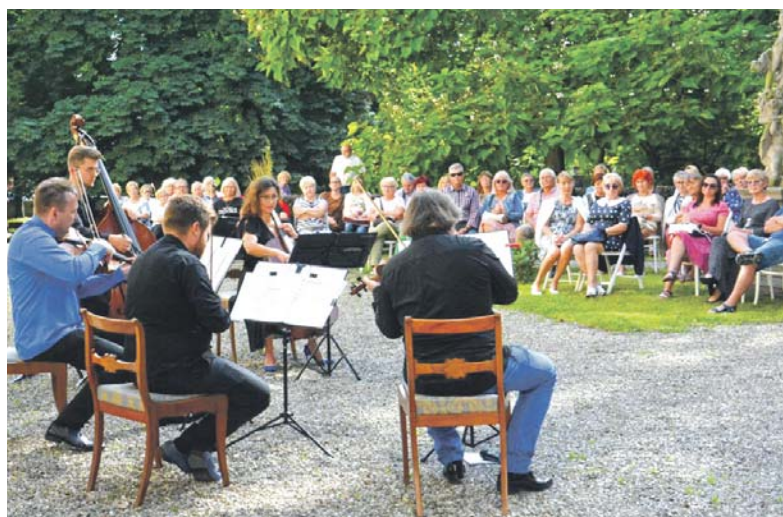
Kwintet Śląskich Kameralistów podczas poprzednich edycji wydarzenia zorganizowanych w pałacowym parku.

Koncerty z cyklu „Muzyka na wagę” w wykonaniu Kwintetu Śląskich Kameralistów już kilkakrotnie przyciągały melomanów do pałacowego parku. W tym roku w pięknych okolicznościach przyrody Pałacu Mieroszewskich dźwięki wybrzmia ponownie 4 i 11 sierpnia. Biletem wstępu będą... drobne elektroodpady.