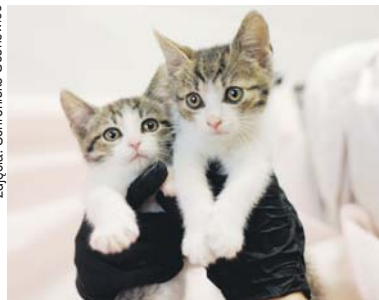
Akwela 380/2024 i Pędzel 381/2024 mieszkają w schroniskowej klatce.