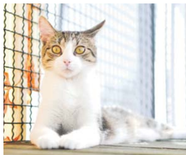
Norton 173/2024 czeka na swojego człowieka w dziale adopcyjnym.