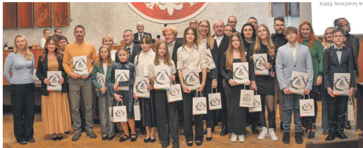
Rady Miejskiej Bę

➤ W ostatnią środę listopada odbyła się siódma sesja Rady Miejskiej, podczas której uroczystie wręczono Stypendia Miasta Będzina trzynastu uczniom i uczniom będzińskich szkół podstawowych i szkoły muzycznej oraz trzem studentkom za osiągnięcia w roku szkolnym i akademickim 2023/2024.