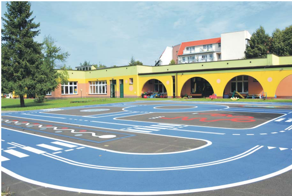
W ramach jednej z poprzednich edycji budżetu obywatelskiego przy Przedszkolu Miejskim nr 2 im. Kawalerów Orderu Uśmiechu powstało miasteczko ruchu drogowego.