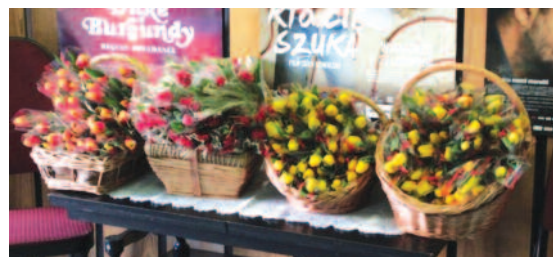
Weekend Kobiet rozpoczął się w sobotę seansem filmu „Razem czy osobno” w kinie Nowość. Następnego dnia panie obejrzały film „Wiek Adaline”. Wszystkie też dostały tulipany.