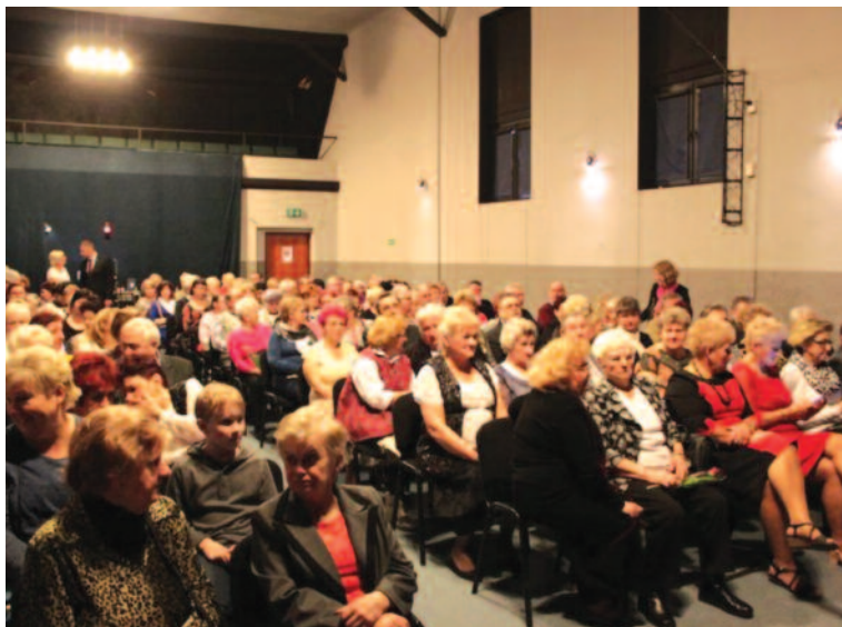
W filii Ośrodka Kultury w Grodźcu w sobotę wystąpił znany z wielu przebojów, polski artysta, kompozytor, satyryk, tancerz i choreograf – Andrzej Rosiewicz. W latach 70. i na początku 80. był jednym z najpopularniejszych piosenkarzy estradowych, występował podczas festiwali w Sopocie i Opolu.