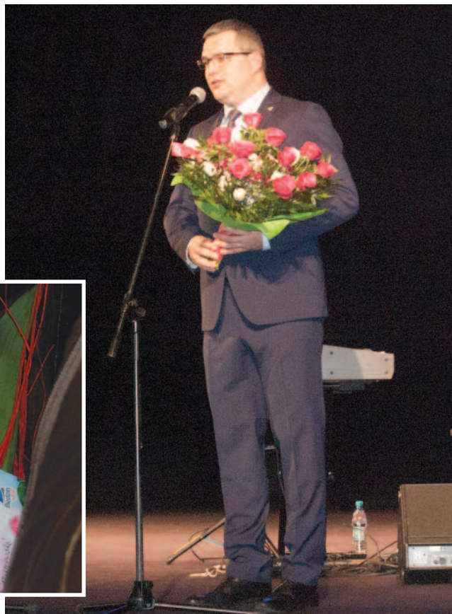
Prezydent Łukasz Komoniewski złożył życzenia paniom zgromadzonym w teatrze.