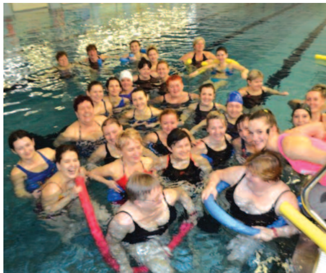
W niedzielę na terenie krytej pływalni OSIR odbył się maraton aqua aerobiku. W programie przewidziany był trening wzmacniający oraz zumba w wodzie. Dodatkowymi atrakcjami były upominki, konsultacje z dietetykiem oraz porady kosmetyczki.