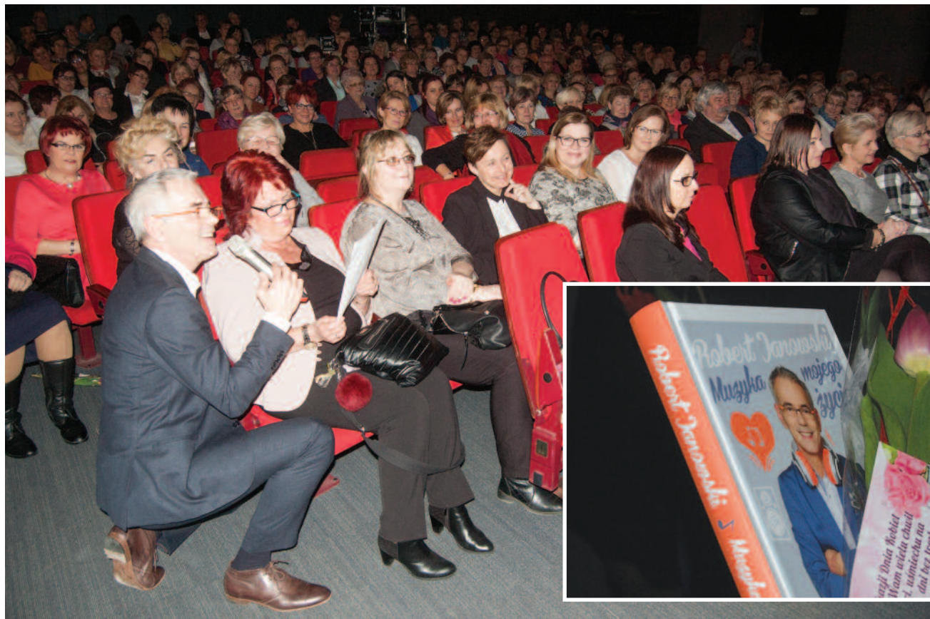
W niedzielę na deskach będzińskiego teatru z recitalem wystąpił Robert Janowski. Artysta bawił publiczność nie tylko znanymi przebojami, własnymi i innych artystów, ale też humorystycznie prowadzoną konferansjerką. Rozbawione panie śpiewały razem z nim.

KONCERTY, SEANSE FILMOWE, MARATON ZUMBY I AQUA AEROBIKU ORAZ FESTIWAL ZDROWIA I URODY TO NIE LADA ATRAKCJE, JAKIE PRZYGOTOWANE ZOSTAŁY DLA PAŃ 5 I 6 MARCA Z OKAZJI ICH ŚWIĘTA. DZIĘKI NIM MIESZKANKI BĘDZIŃA MOĞY ODPOCZAĆ, NAŁADOWAĆ AKUMULATORY, POSŁUCHAĆ DOBREJ MUZYKI - A WSZYSTKO TO W PRZYJAZNYM KOBIECYM GRONIE!