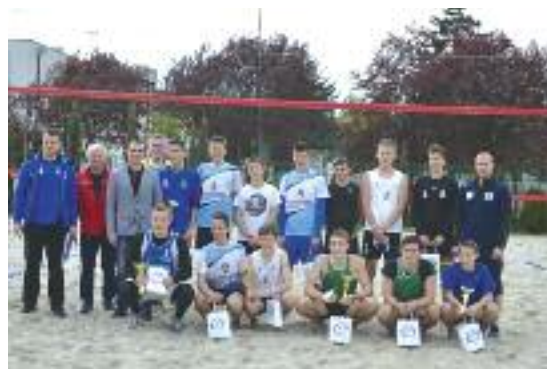
PŁAZOWA PIŁKA SIATKOWA

Trzy najlepsze zespoły otrzymały pamiątkowe puchary, dyplomy oraz nagrody rzeczowe. Dla wszystkich uczestników zawodów przygotowano poczęstunek,