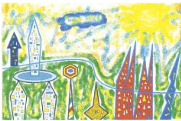
I miejsce. Klasy I – III.