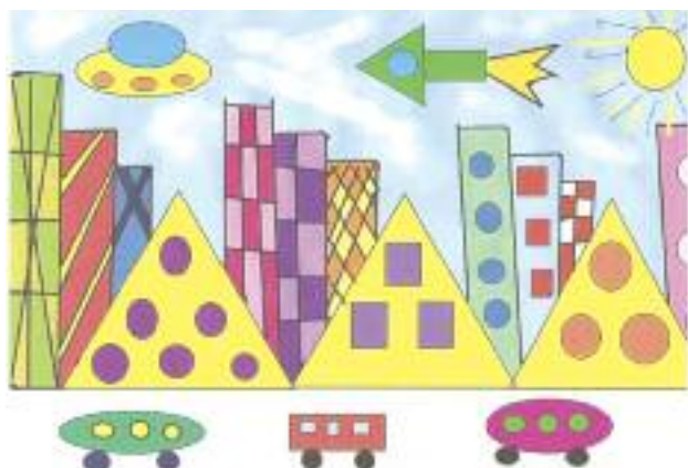
I miejsce. Przedszkola i klasy 0.

Więcej informacji znajduje się na stronie: www.sp10bedzin.pl