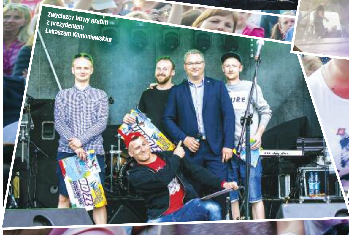
Zwycięzcy bitwy graffiti z prezydentem Łukaszem Komoniewskim