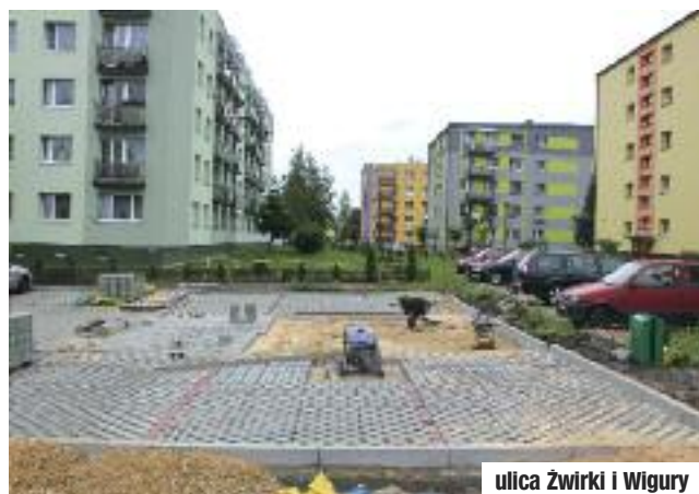
ulica Żwirki i Wigury